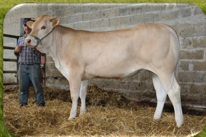
F2 - VAGABONDE

Contact : 0684090020 – 0553961403 – blondegenetique@orange.fr www.blondegenetique.fr