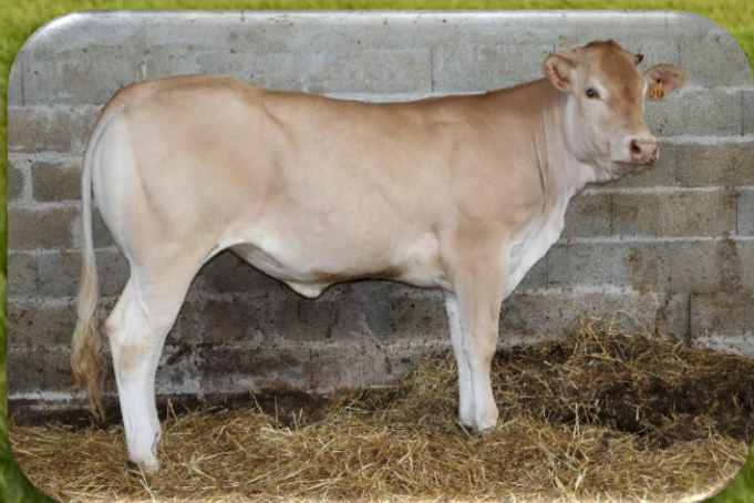
F1 – VICTOIRE